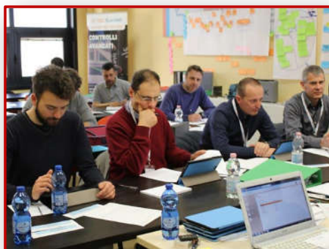
Ruolo di esaminatore 3° livello Sessione esami 3° livello c/o Ente di Certificazione

Training on the job, gestione qualifiche impianti, progettazione Procedure e validazione processi PnD.