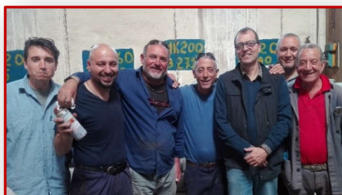
Immagini dalla ns. Formazione Foto dall'ultimo corso PT – Giugno '16