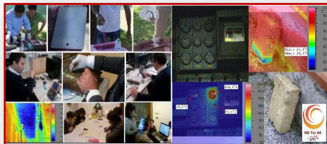
Immagini dalla ns. Formazione

1.c) Ruolo di Direttore tecnico (DT) , quale responsabile delle attività PnD per Organismo di Ispezione in conformità alla Normativa UNI CEI EN ISO 17020 .