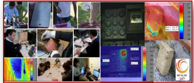
Immagine dalla ns. Formazione

1.b) Ruolo di 3° livello esterno per il coordinamento delle attività PnD all'interno di un'azienda (predisposizione di Procedure ed istruzioni operative, Audit interni ed esterni, implementazione di impianti e strumentazioni PnD, ecc.....).