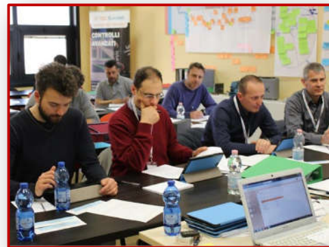
Sessione esami 3° livello presso Tec- Eurolab

Formazione, qualificazione 1° e 2° livello, Training on the job, gestione qualifiche impianti, progettazione Procedure e validazione processi PnD.