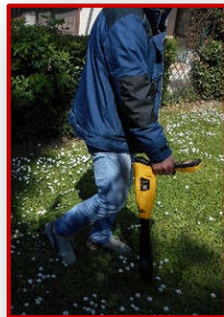
Monitoraggio EMC e ric. perdite