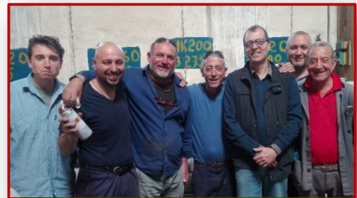
Immagine dalla ns. Formazione Foto dall'ultimo corso PT – Giugno '16