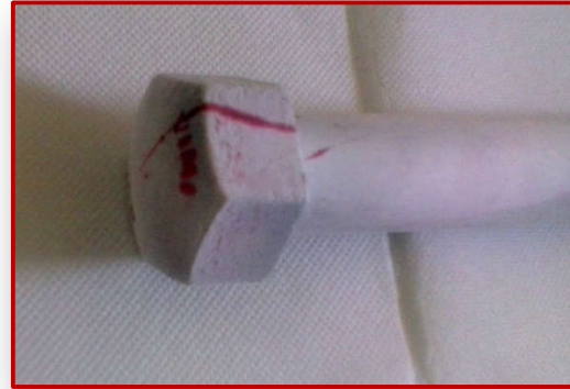
Esempi di esercitazioni durante un Corso PT – Dicembre 2019

L'esperienza di 30 anni nel settore, con competenze multisetoriali nei campi più diversificati delle PnD garantisce una capacità di risposta che non ha uguali sul territorio campano e del Sud Italia.