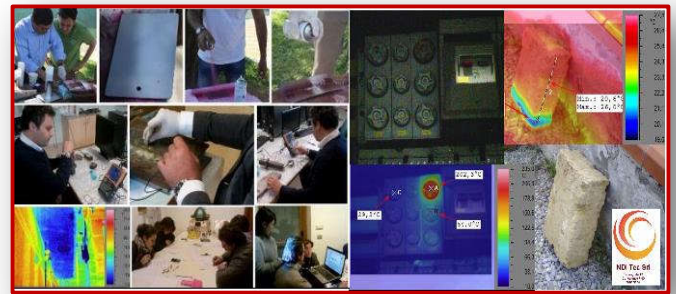
Immagini dalla ns. Formazione

1.b) Ruolo di 3° livello esterno per il coordinamento delle attività PnD all'interno di un'azienda (predisposizione di Procedure ed istruzioni operative, Audit interni ed esterni, implementazione di impianti e strumentazioni PnD, ecc.....).