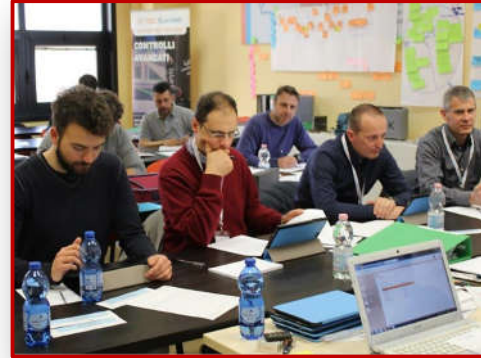
Sessione esami 3° livello presso Tec- Eurolab

Formazione, qualificazione 1° e 2° livello, Training on the job, gestione qualifiche