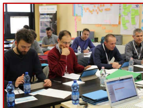
Sessione esami 3° livello presso Tec- Eurolab

Formazione, qualificazione 1° e 2° livello, Training on the job, gestione qualifiche impianti, progettazione Procedure e validazione