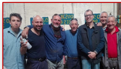
Immagine dalla ns. Formazione Foto dall'ultimo corso PT – Giugno '16