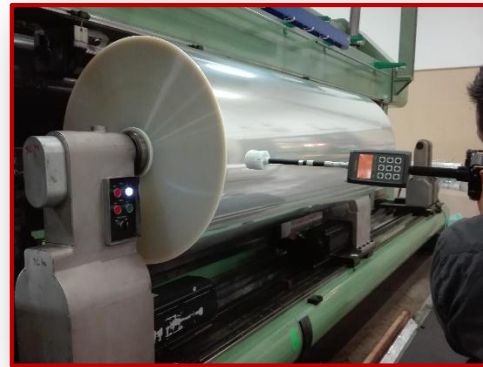
Monitoraggio campi elettrici e magnetici