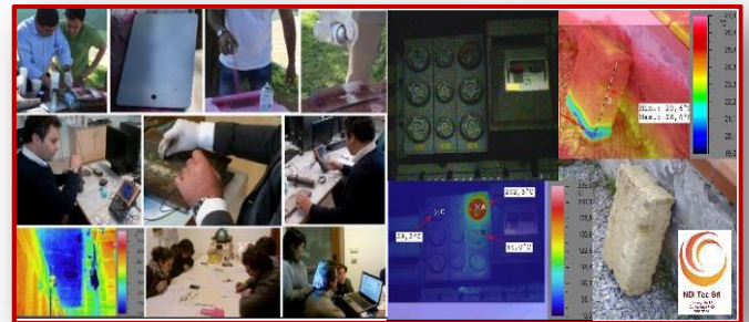
Immagini dalla ns. Formazione

1.b) Ruolo di 3° livello esterno per il coordinamento delle attività PnD all'interno di un'azienda (predisposizione di Procedure ed istruzioni operative, Audit interni ed esterni, implementazione di impianti e strumentazioni PnD, ecc.....).