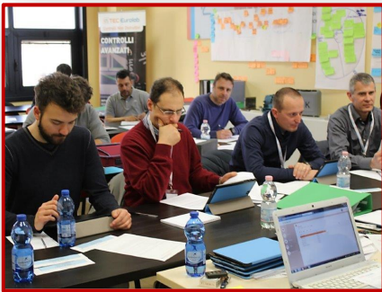
Sessione esami 3° livello presso Tec- Eurolab

Formazione, qualificazione 1° e 2° livello, Training on the job, gestione qualifiche impianti, progettazione Procedure e validazione processi PnD.