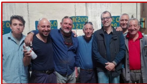
Immagini dalla ns. Formazione Foto dall'ultimo corso PT – Giugno '16